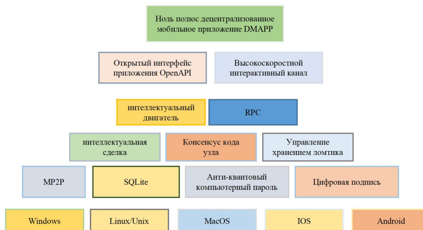
Диаграмма 1 нулевая структура

Концепция цепочки мобильных транзакций, предложенная нулевой полюс, заключается в парковке узлов цепочки транзакций на мобильных устройствах, таких как смартфоны и планшеты, которые могут запускать узлы в цепочке транзакций. Сеть мобильной торговли действительно отражает децентрализованную природу, и каждый дополнительный узел добавляет разменную монету к безопасности всей сети. Чем больше участвующих узлов, тем быстрее подтверждение транзакции и тем выше пропускная способность системы. На рисунке 1 показана архитектура системы нулевой полюс.